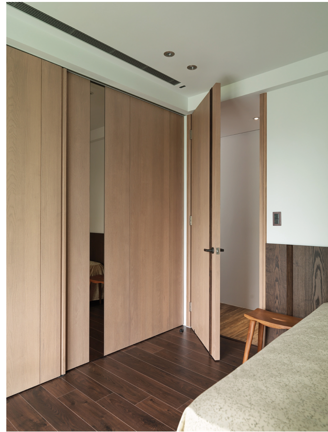
左頁：閱讀區域兩側以木條樺接構成一道大型拉門，以作為空間串聯 右頁：增添藍色元素的家飾平衡棕色系的空間，滿足空間的完整性和設計精神